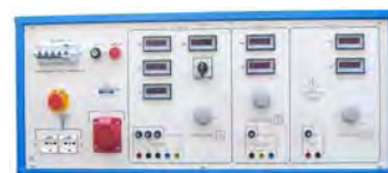
Immagine rappresentativa della gamma

E' disponibile anche: modello carrellato con le medesime caratteristiche tecniche. A richiesta, interfaccia seriale RS-232.