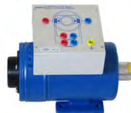
IMMAGINE RAPPRESENTATIVA DELLA GAMMA

- A4220FS Simulatore Guasti Per Motore A Gabbia Di Scoiattolo cad. € 286,70